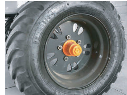
Llantas reforzadas de diseño exclusivo con medidas a elección: (400/60 -15.5) (400/55-22.5) - (500/45-22.5).