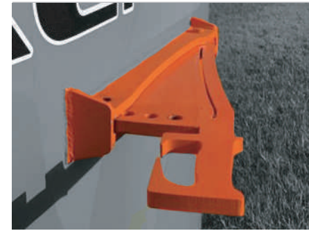
GUILLOTINA HORIZONTAL con regulación de profundidad y corte mediante cuchillas dentadas (Patentada).