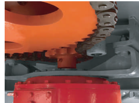
Caja ORIPON con sistema de transmisión a través de piñón, corona y cadena REGINA Italiana.