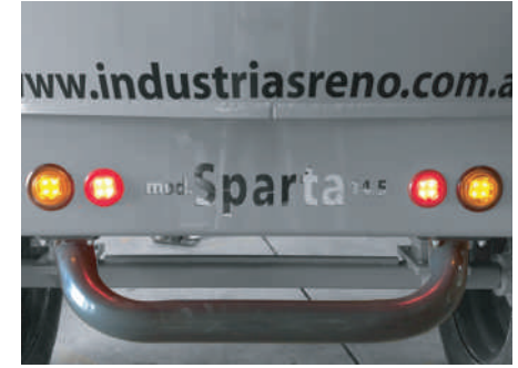
Luces LED independientes conectadas a la batería de la balanza. Paragolpes reforzados de caño rolado en 3.5 mm. de espesor.