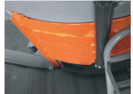
Puerta reforzada con 5 costillas de 6 mm. y una novedosa trampa de pasto única en el mercado.