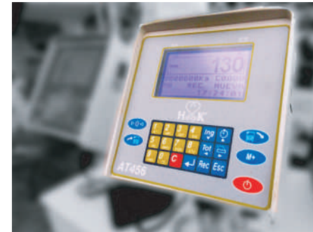
Balanza Hook modelo AT456 con display gráfico de última generación para 99 recetas de carga, con acceso a pendrive o WIFI.